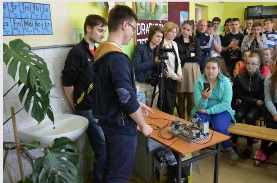
Pokazy z elektroniki

Na pokazach nasi elektronicy demonstrowali roboty wykonane z elementów optoelektronicznych oraz łazika programowanego na sterowniku PLC.