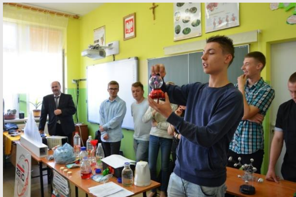
Doświadczenia z fizyki

8 maja 2015 r podczas dni otwartych w Publicznym Gimnazjum w Boratynie zostały przeprowadzone pokazy z udziałem uczniów naszej szkoły.